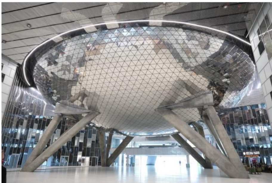
สิ่งก่อสร้างดูล้ำสมัย