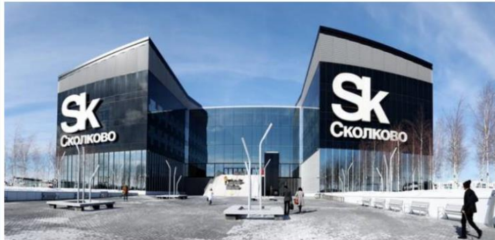
Skolkovo ซิลิคอนวัลเลย์แห่งรัสเซีย

105K people like this. Sign Up to see what your friends like.