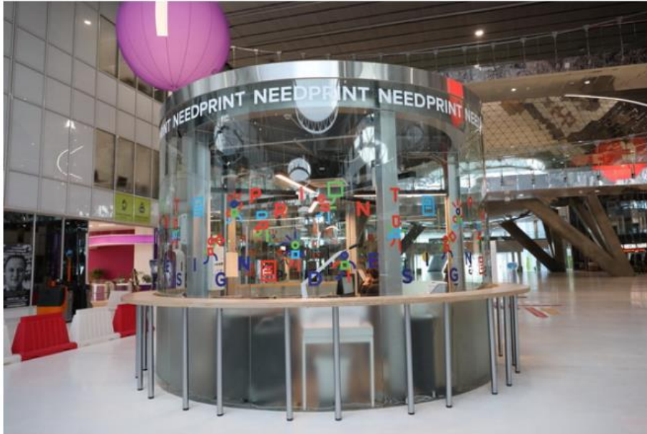
บรรยากาศภายใน

SKOLKOVO เป็นโครงการที่จัดตั้งขึ้นโดยรัฐบาลรัสเซียโดยออกเป็นกฎหมายรองรับเมื่อวันที่28 ธันวาคม 2010 โดยจะให้การสนับสนุนเฉพาะผู้ประกอบการที่จัดตั้งบริษัทในรัสเซียเท่านั้น โดยมีพันธกิจคือสร้างกลุ่มนักพัฒนาเทคโนโลยีใหม่เพื่อก้าวข้ามอุปสรรคในเชิงระบบ พร้อมกับสนับสนุนส่งเสริมในการเชื่อมโยงสู่สังคมนวัตกรรมของโลกสมัยใหม่