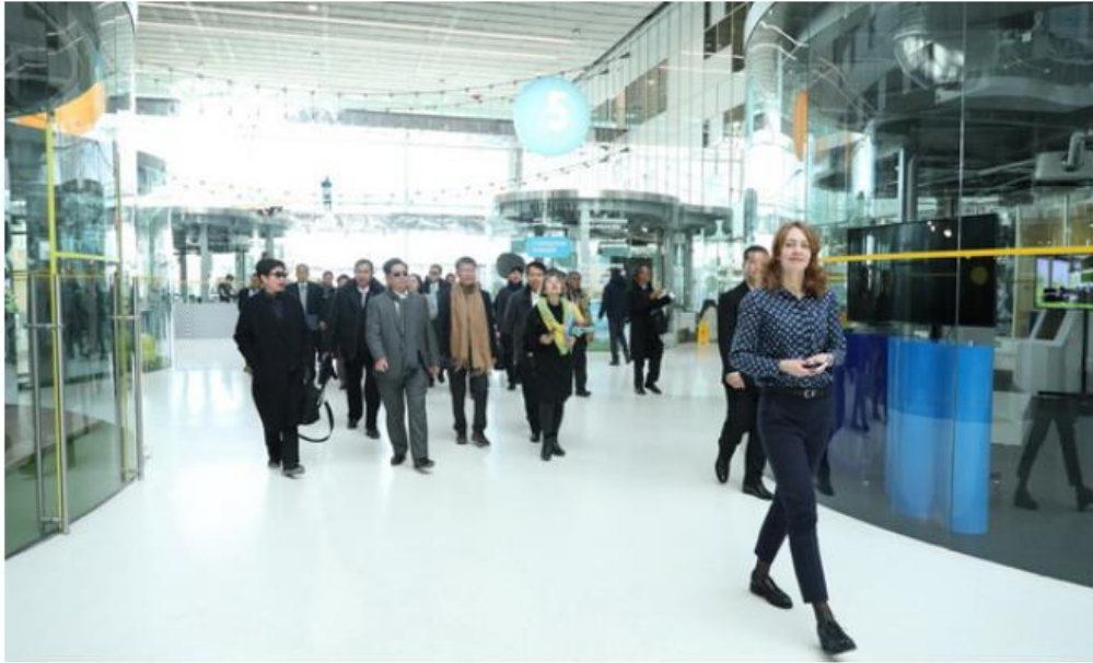
เยี่ยมชมภายในอาคาร