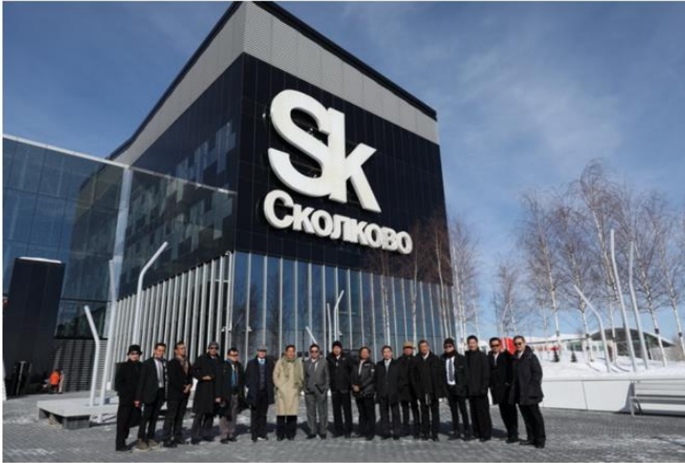
ถ่ายภาพร่วมกันเป็นที่ระลึก

บ้านเมืองออนไลน์ขอชื่นชมในความคิดริเริ่มและการสนับสนุนของ ปตท.และขอเป็นกำลังใจให้โครงการวังจันทร์วัลเลย์ เป็นต้นแบบ ความหวังและที่พึ่งของสตาร์ทอัพไทยเพื่อสามารถพัฒนาไปต่อสู้นเวทีระดับโลกได้อย่างประสบความสำเร็จ