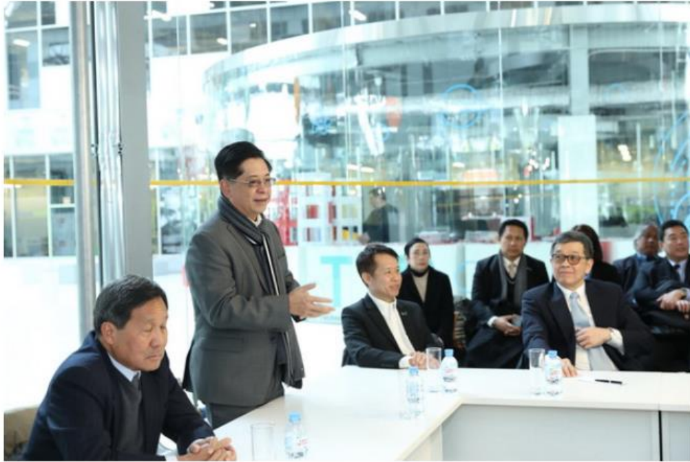
ผู้บริหารปตท. ให้ความสนใจแลกเปลี่ยนความรู้กับผู้แทนจากSkolkovo

1 ใน 3 ของการเจรจาตกลงลงทุนด้านventureใน รัสเซียเป็นของSkolkovo มี46 ราย ที่ลงทุนใน Venture Funds และมีการลงทุนในstart upมากกว่า 150 รายกว่า600 คนจบปริญญาโทและเอกจากSkolkovo tech มีศูนย์ความเป็นเลิศด้านวิจัย การศึกษาและ นวัตกรรมมากถึง 10 ศูนย์ 65% ของนักเรียนมีส่วนร่วม เกี่ยวข้องกับบริษัท startupรายได้จากการซื้อขายเทคโนโลยีมากกว่า 8.5 พันล้านรูเบิล และสิทธิบัตรมากกว่า 800 ฉบับ