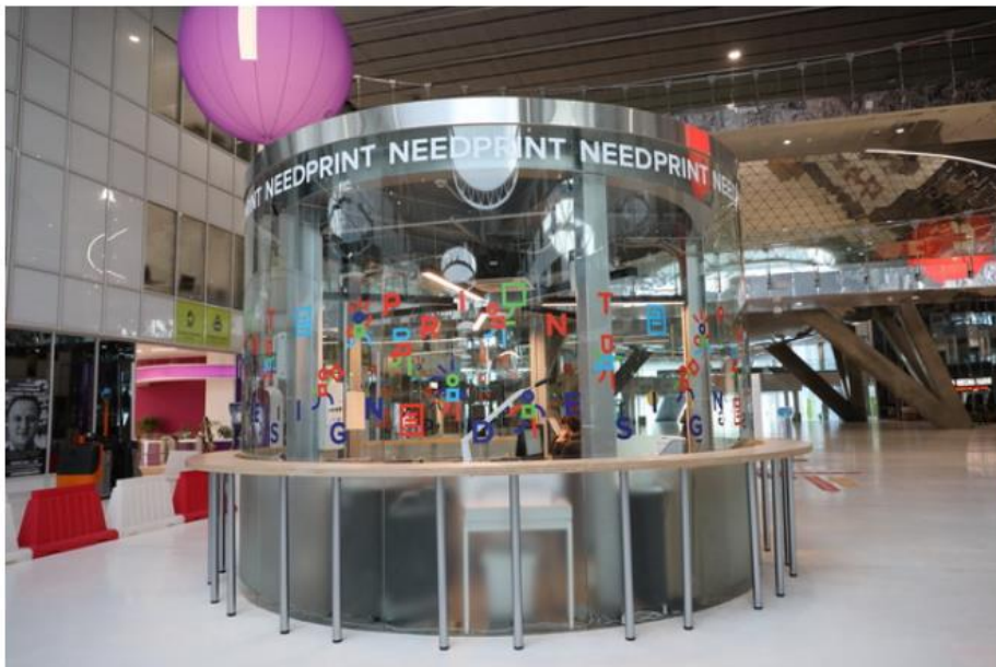
บรรยากาศภายใน

SKOLKOVO เป็นโครงการที่จัดตั้งขึ้นโดยรัฐบาลรัสเซียโดยออกเป็นกฎหมายรองรับเมื่อวันที่28 ธันวาคม 2010 โดยจะให้การสนับสนุนเฉพาะผู้ประกอบการที่จัดตั้งบริษัทในรัสเซียเท่านั้น โดยมีพันธกิจคือสร้างกลุ่มนักพัฒนาเทคโนโลยีใหม่เพื่อก้าวข้ามอุปสรรคในเชิงระบบ พร้อมกับสนับสนุนส่งเสริมในการเชื่อมโยงสู่สังคมนวัตกรรมของโลกสมัยใหม่